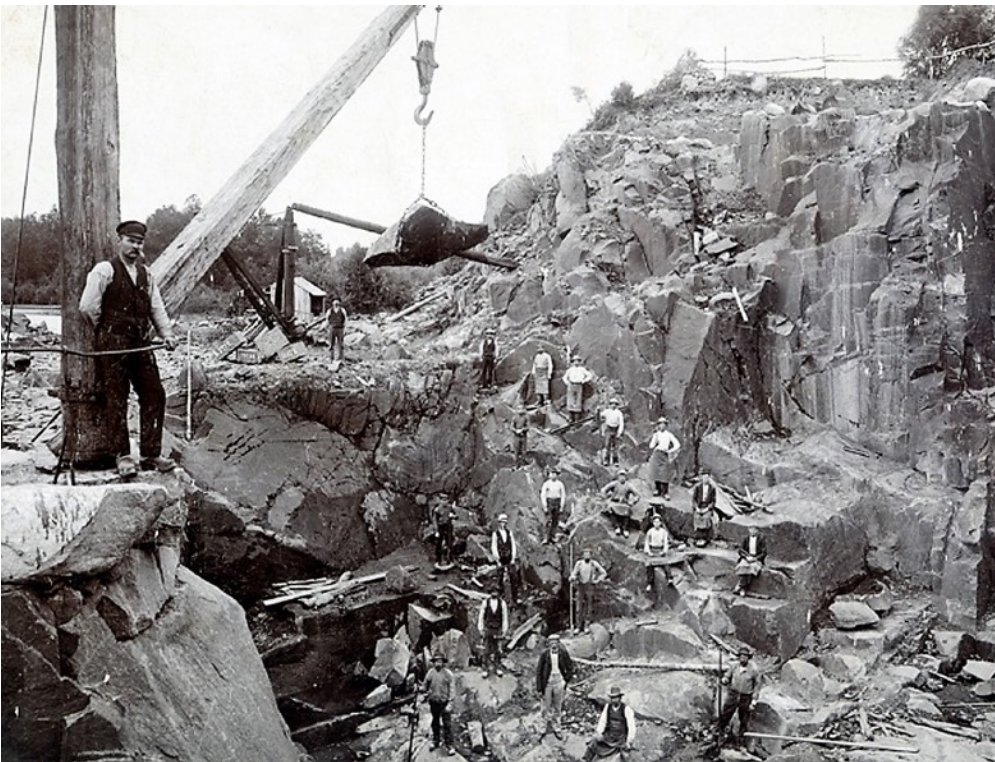
Svenska Granitindustri AB:s stenbrott i Gylsboda på 1890-talet. Vid normal drift arbetade här omkring 400 personer.