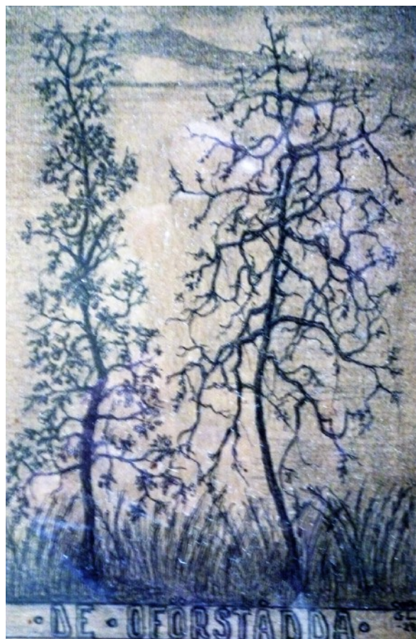
Teckning av Gustaf Lyberg 1928. I Sölvesborgs och Listers fornminnes- förenings samlingar

Bolagets förnämsta råmaterial var den i de flesta europeiska och transmarina länderna kända exklusiva "svarta graniten", diabasen, som bröts i företagets egna stenbrott bl.a. i Gylsboda några kilometer söder om Lönsboda. Härifrån kunde de mäktiga råblocken genom järnvägen mellan Älmhult och Sölvesborg, som öppnades för trafik 1901, effektivt transporteras till utskeppningsorten. Den röda graniten bröt man i företagets egna stenbrott på ostkusten eller i Norge.