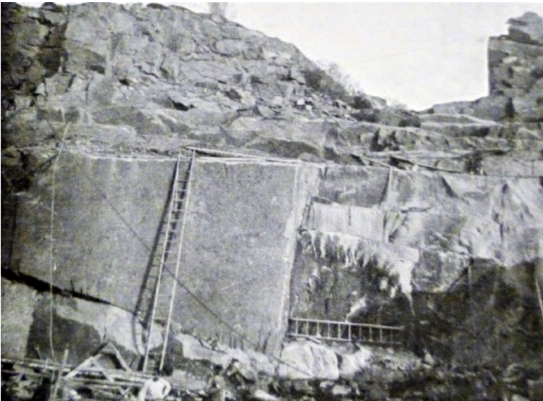
Ett tidstypiskt stenbrott i det nordostskånska granitstenriket.

Mäktiga, massiva råblock av den svarta graniten redo för vidareförädling.