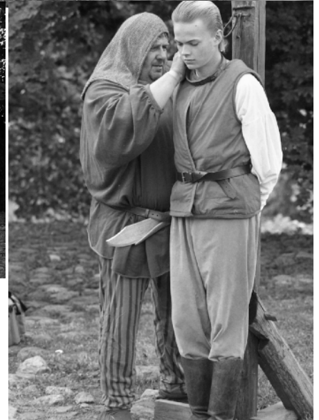
Den svenske spionen tvingas på knä, kastas i fängelsehålan och förs så småningom till galgen