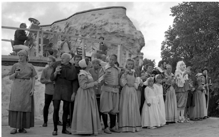
Ensemblen med musiker avtackas av publiken