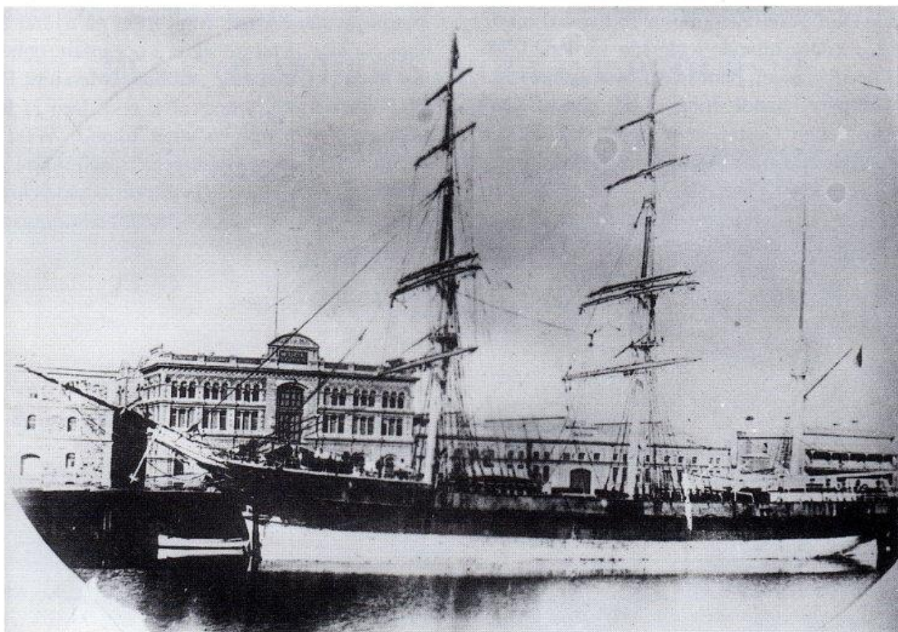
Den gamla järnbarken EDWARDINA av Sölvesborg var svensk några år kring sekelskiftet innan hon förläste 1906.

Även om Sölvesborg inte är landets främsta sjöstad så har både fartyg och sjöfolk från staden under årens lopp varit med om åtskilliga dramatiska händelser. En av dem var när den tremastade barken "EDWARDINA" af Sölvesborg gick på klipporna och blev vrak utanför Costa Ricas kust i Centralamerika i mars 1906.